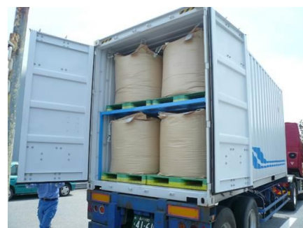
特殊20Fハイキューブコンテナと専用ラック

これからも当社は、地球環境及びドライバー不足の解決にも積極的に取り組んでまいります。